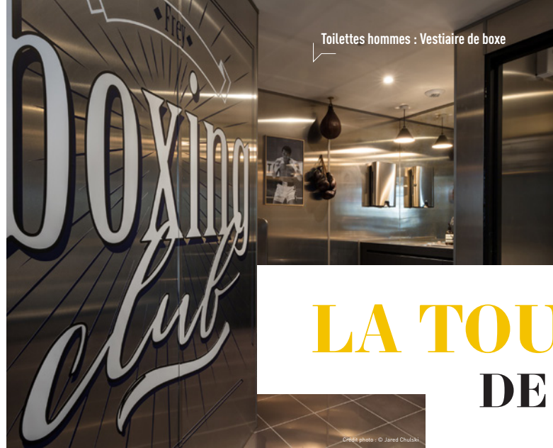
Toilettes hommes : Vestiaire de boxe